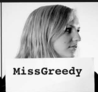
Lone Greedy aka. Økonomiansvarlig Forvalter av vår formue.

Etterlyst for: Alvorlig underslag og krenkende artikler